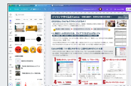
本資料もPC版Canvaで作ってます

デザインが上手くなる・慣れてくると一言で言っても、「PC・Canvaの使い方の習得」と「デザインの引き出しが増え、作るのに慣れてくる」と分解できます。いずれにしろマメな情報収集と場数で徐々にレベルアップすることが可能です。