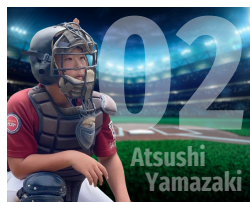
生成した野球場の背景に、背景除去した息子の写真を重ねたもの

使用できる「使える」素材やテンプレートが増えるだけでなく、AIを使った背景除去やマジック生成・消しゴム・切り抜き・拡張などの編集が簡単にできるようになります。